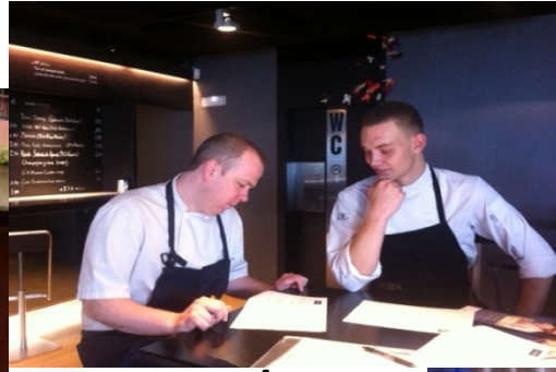
Leonardo Recepción y envío