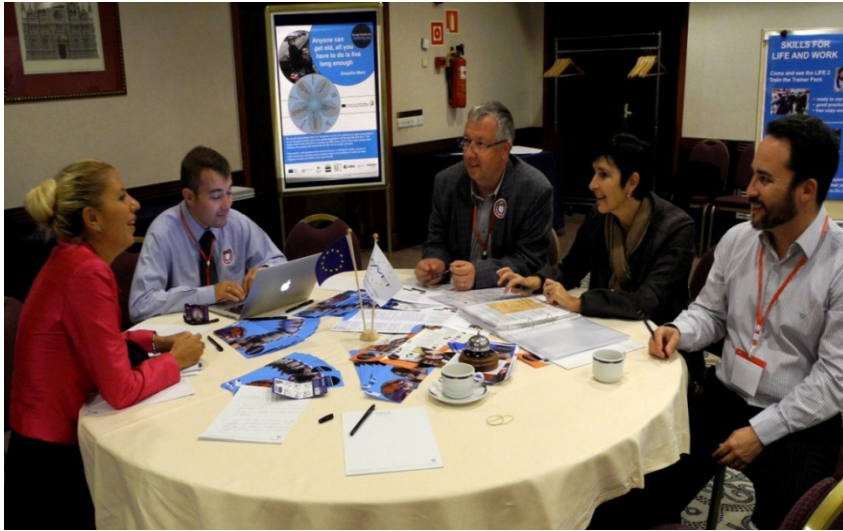
Conferencias internacionales EFVET, Mallorca, Atenas