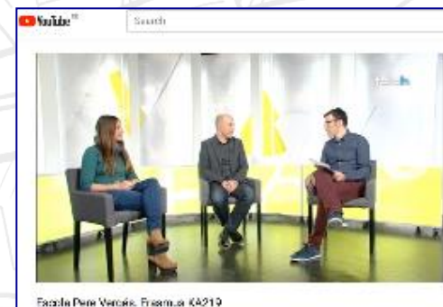
Facultad Deine Vargas, Erasmus+ KA219