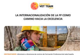
DESTINATARIOS: directores y directoras de centros de Formación Profesional de toda España.