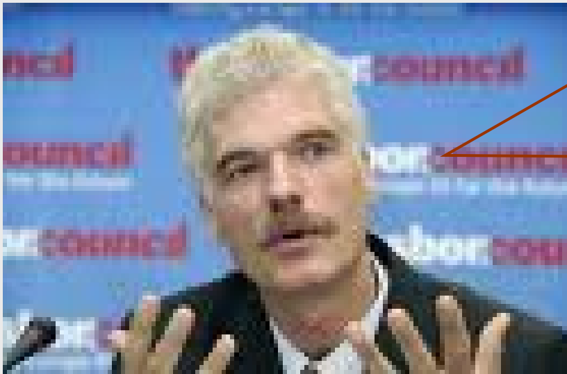
Andreas Schleicher Director PISA-OCDE

Los 10 empleos más demandados en EEUU en 2009 no existían en el 2000